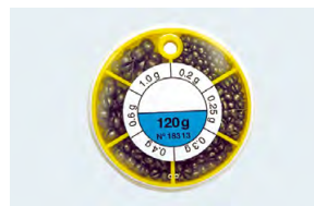
Grenaille de plomb