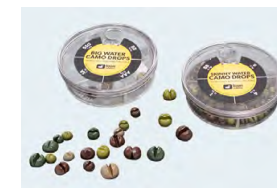
Lest-grenaille en étain