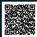
PDF du dépliant

Le plomb n'est pas le seul matériau problématique pour les organismes vivants dans les cours d'eau. Les plastiques, tels que le caoutchouc, les fils de pêches et d'autres matériaux synthétiques peuvent également être nuisibles pour les organismes aquatiques, que ce soit par l'émission de substances dangereuses ou par leur ingestion avec la nourriture. Il faut donc veiller à ce que ces matériaux ne soient pas rejetés dans l'environnement. La nature t'en sera reconnaissante !