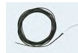
Pointes plongeantes à base de tungstène (pêche à la mouche)