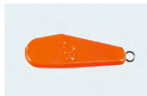
Plomb de traîne